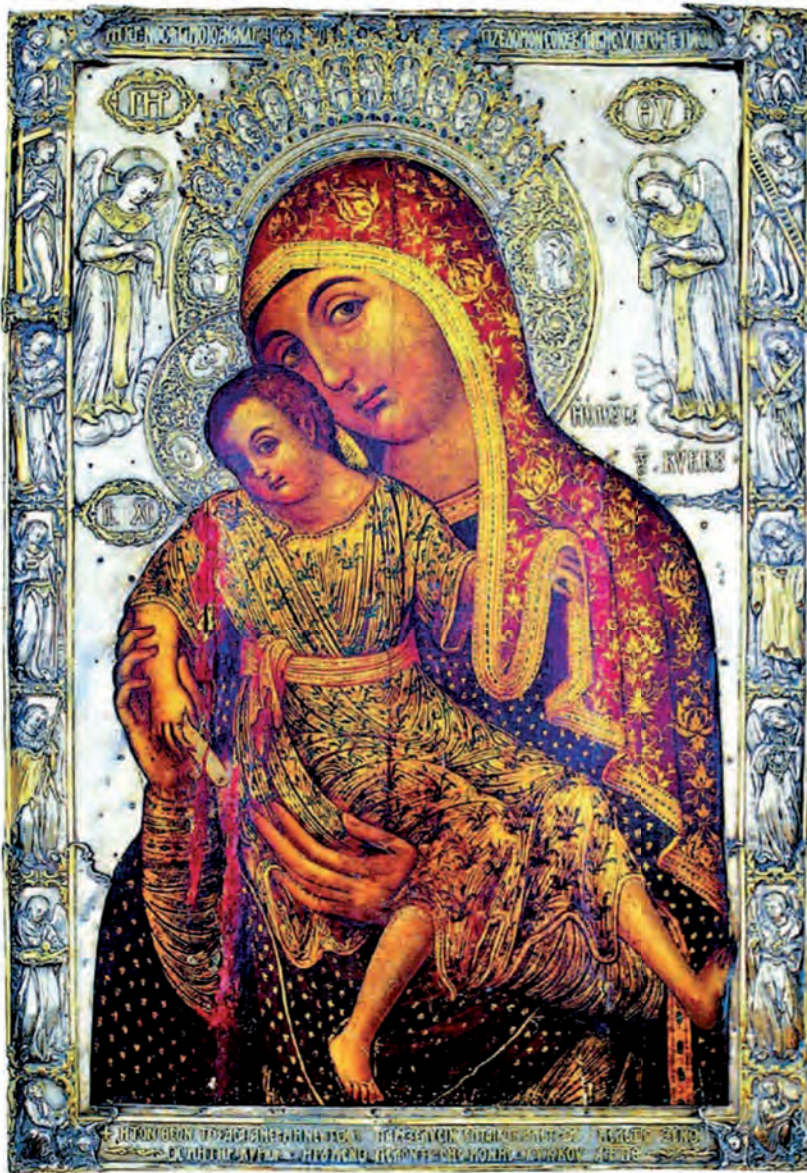
Μήτηρ Θεοῦ ἡ Ἐλεούσα τοῦ Κόκκου, εἰκονοστάσιον Καθολικοῦ Ἱερῶς Μονῆς Κόκκου.