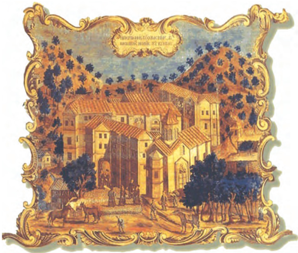
Τερά Μονή Κύκκου. Λεπτομέρεια από χαρακτηριστὸν τῆς Μονῆς, 1778.