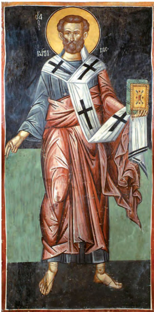
Ὁ Ἀπόστολος Βαρνάβας. Τοιχογραφία Ἱ. Μ. Παναγίας Χρυσοκουρδαλιωτίσσης, 16ος αἰών.